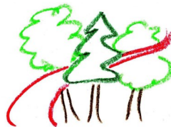
Forstbotanischer Garten Tharandt Sächsisches Landesarboretum

Dieser Flyer ist gedruckt auf 100% Recyclingpapier.